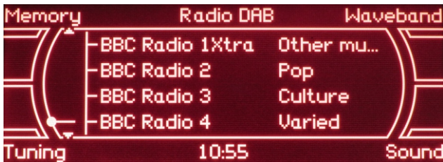
Przykładowa lista dostępnych stacji radiowych rys.5

Po zakończeniu skanowania system automatycznie wyświetli dostępną listę stacji radiowych rys.5. Wybór stacji następnej lub poprzedniej odbywa się przy użyciu głównego pokręćła nawigacyjnego lub dolnych przycisków rys.6.