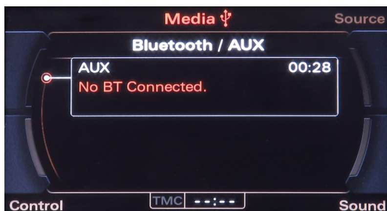
Widok ekranu przy braku podłączonego urządzenia. rys.2

WAŻNE: Funkcja analogowego wejścia liniowego AUX nie posiada możliwości sterowania zewnętrznymi urządzeniami.