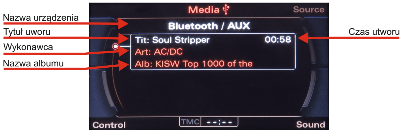
Widok ekranu z podłączonym smartfonem przez bluetooth rys.5

Po poprawnym sparowaniu, urządzenie mobilne powinno się połączyć z modułem JAUX_BT-02 rozpoczynając automatycznie odtwarzanie muzyki.